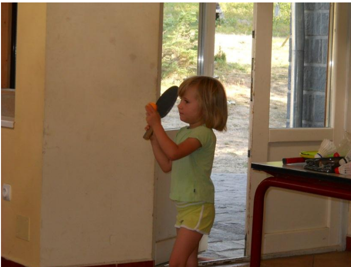
Tafeltennis op je eigen manier