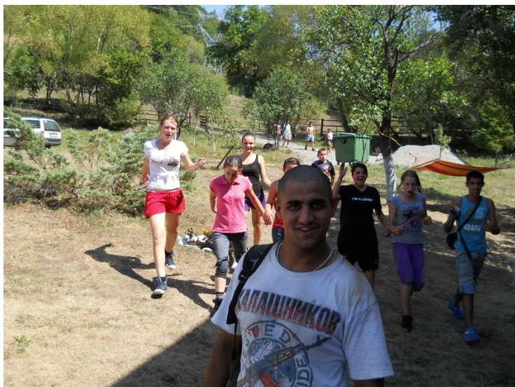
Bergbeklimmen met de grote