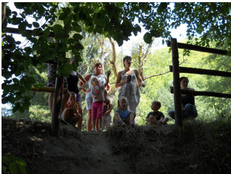
Toekijken met de kleintjes