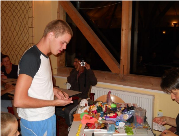
Prijs uitzoeken bij de bingo