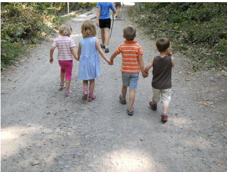
Wandelen met de kleinste