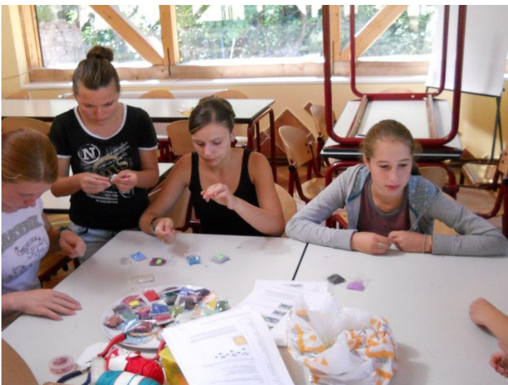
Armbandjes voor de grote meiden