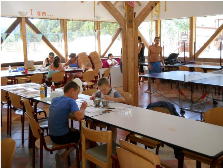
Meerdere activiteiten in het kampgebouw