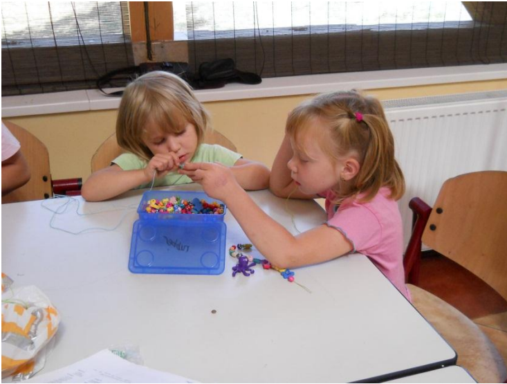
Kettingen voor de kleine